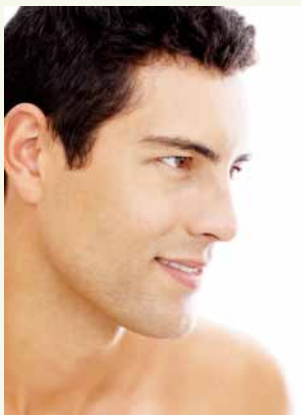
Die perfekte Nase

Kurzum: In Stuttgart ist die Sophienklinik mit ihrem umfassenden Sicherheitskonzept die Adresse für „eine neue Nase“. Überzeugen Sie sich selbst davon bei einem Beratungsgespräch. ◆