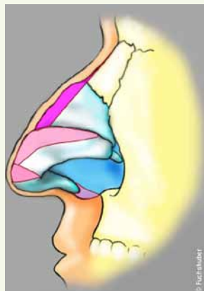
Markierung der zu korrigierenden Nasenteile